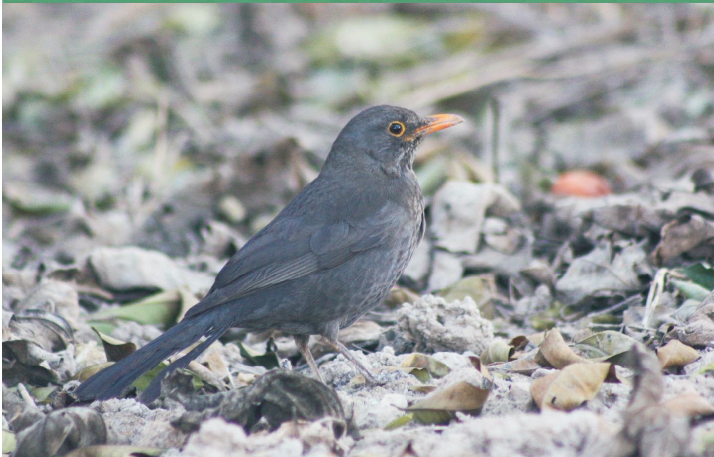
Mirlo común buscando alimento entre la hojarasca