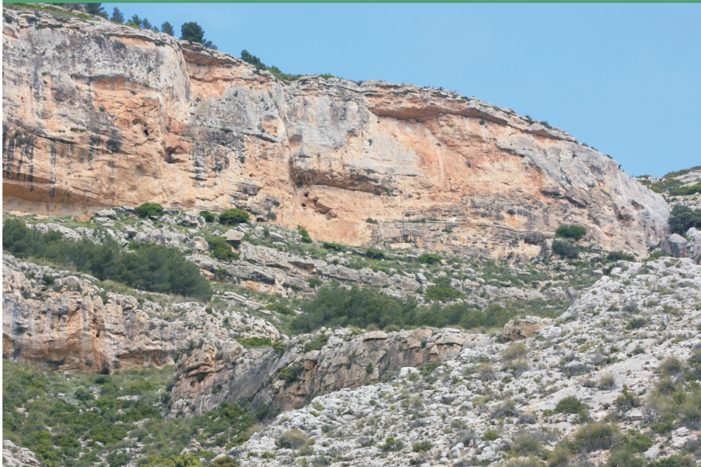
Uno de los cortados rocosos donde aparece el avión roquero