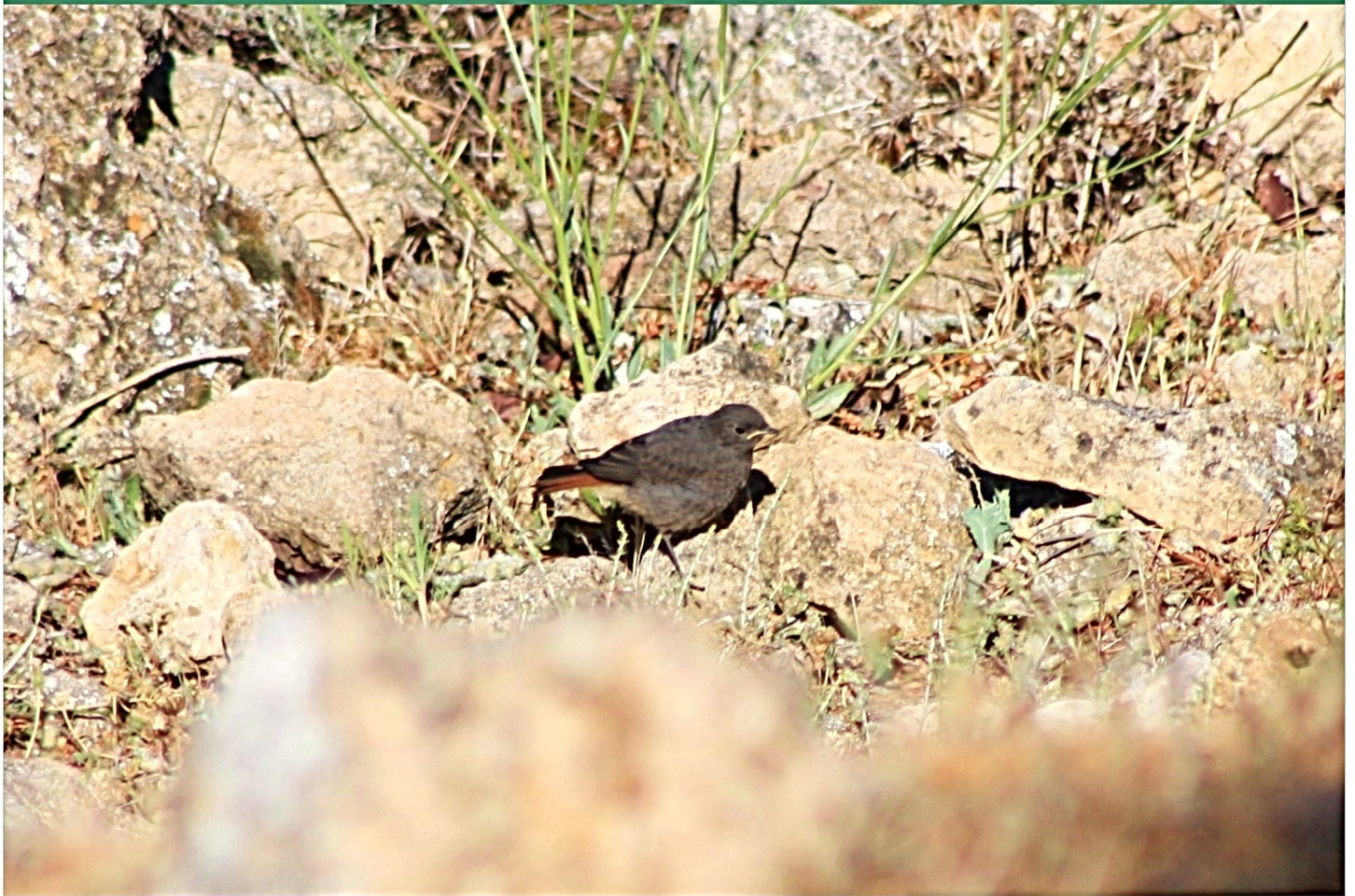
Joven colirrojo tizón en zona pedregosa