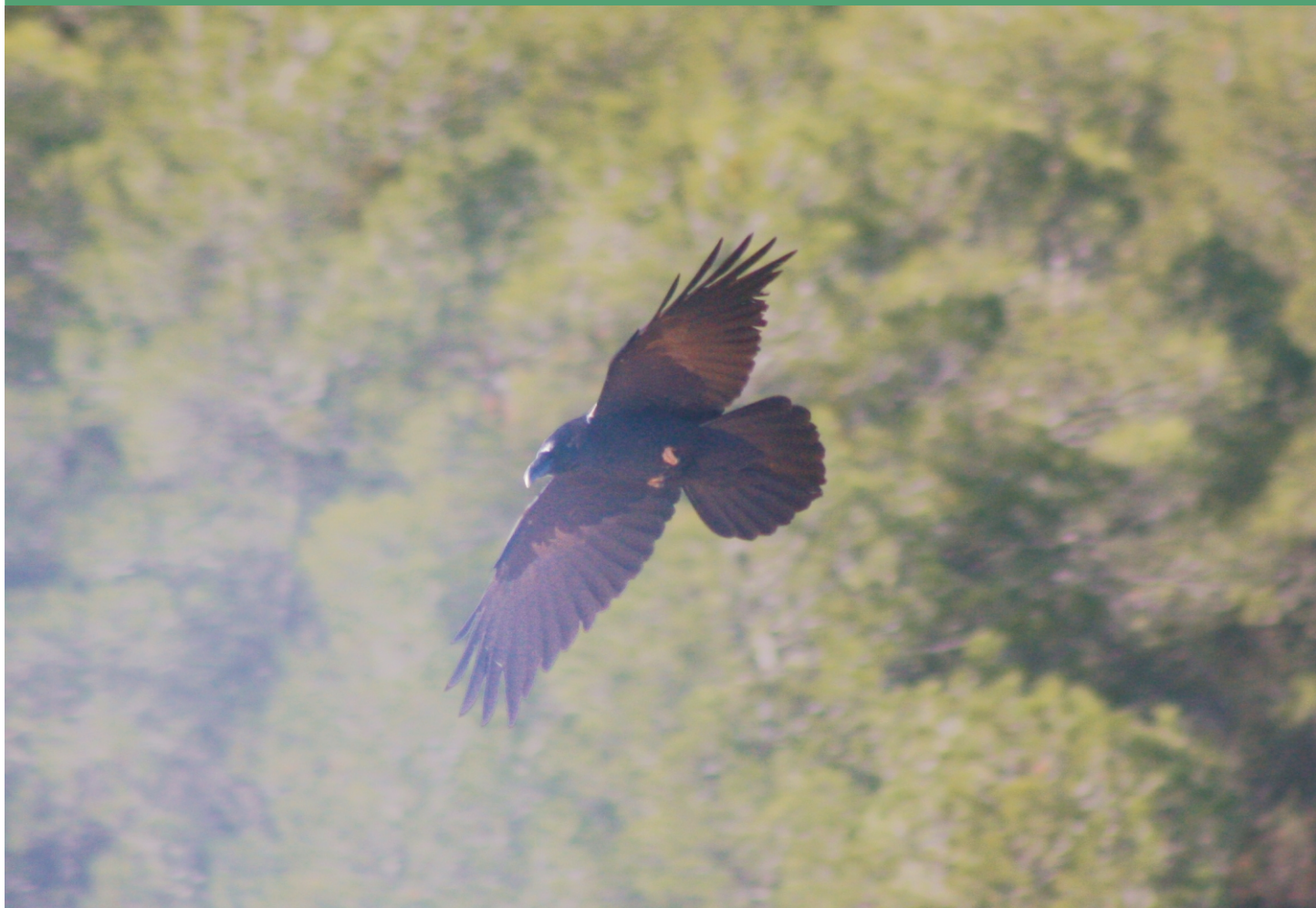
Cuervo en vuelo