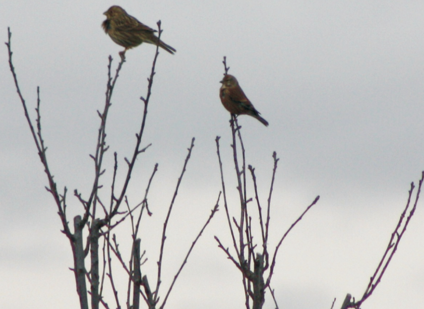
Pardillo común (dcha.) junto a triguero, especie con la que se asocia en bandos mixtos