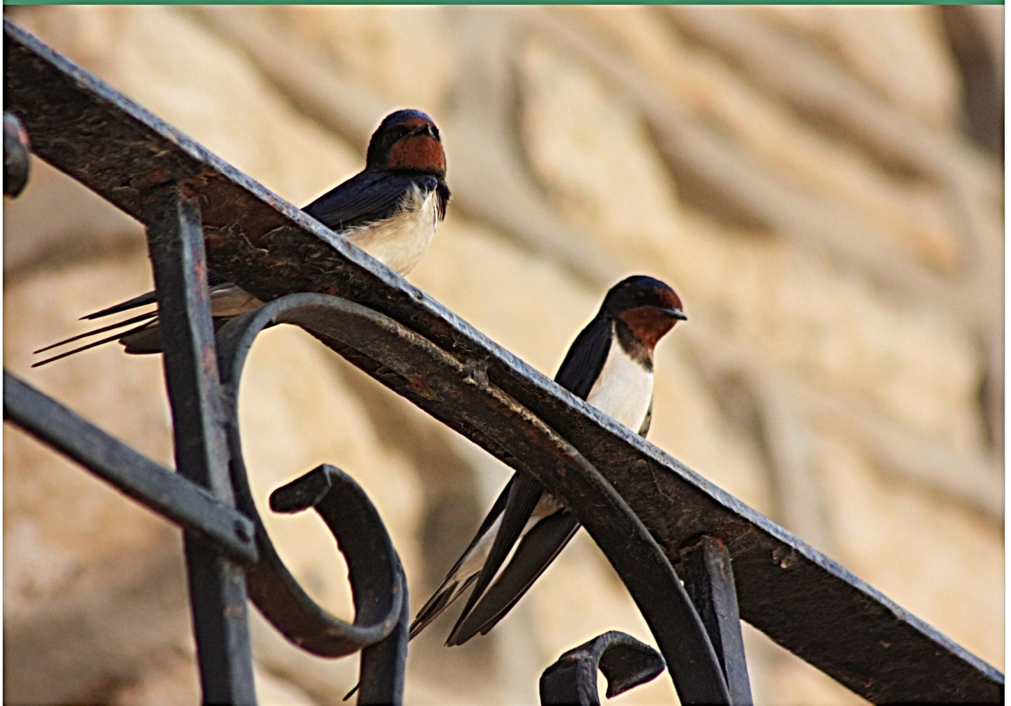
Pareja de golondrinas comunes