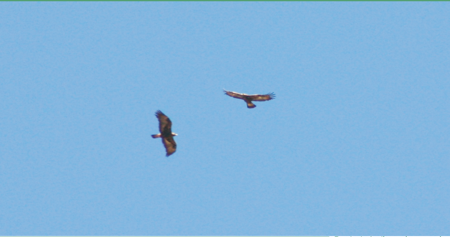
Pareja de águilas reales en vuelo