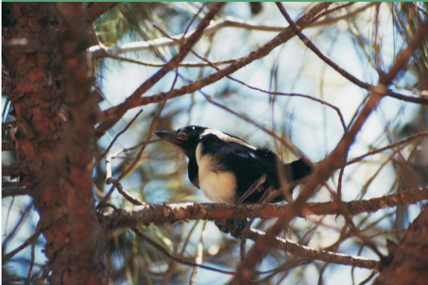
Joven urraca recién salida del nido