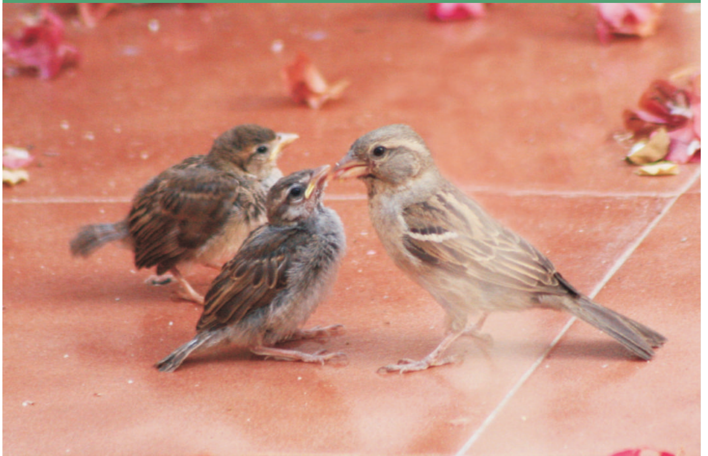
Hembra de gorrión común cebando a dos pollos