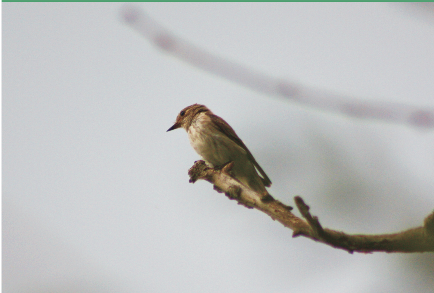
Papamoscas gris en su atalaya