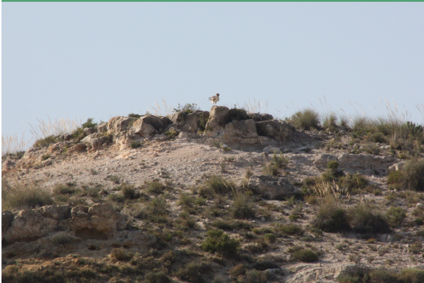
Culebrera posada en un área de matorral abierto